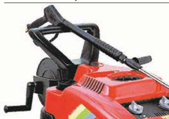
Enrollador de manguera KIT P35-18 cod: IKTRI 39112