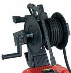
Enrollador de manguera KIT P35-23 cod: IKTRI 39117