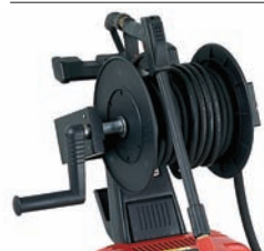
Enrollador de manguera : KIT P35-24: IKTRI 39118