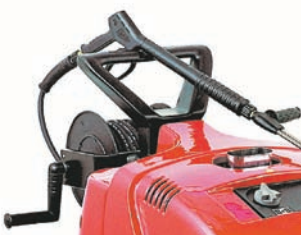
Enrollador de manguera KIT P-35-19 cod: IKTRI 39113