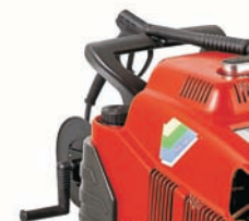
Enrollador de manguera : KIT P35-20: IKTRI 39114