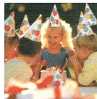
GUARDERÍAS Y COLEGIOS