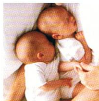
LA SALUD FAMILIAR