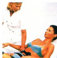
ESTÉTICA Y PELUQUERÍAS