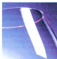
BARRO Y RESTAURANTES