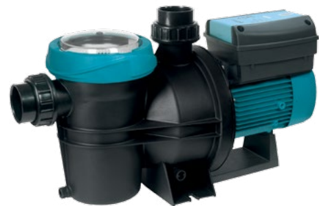
Silenplus 2M y 3M